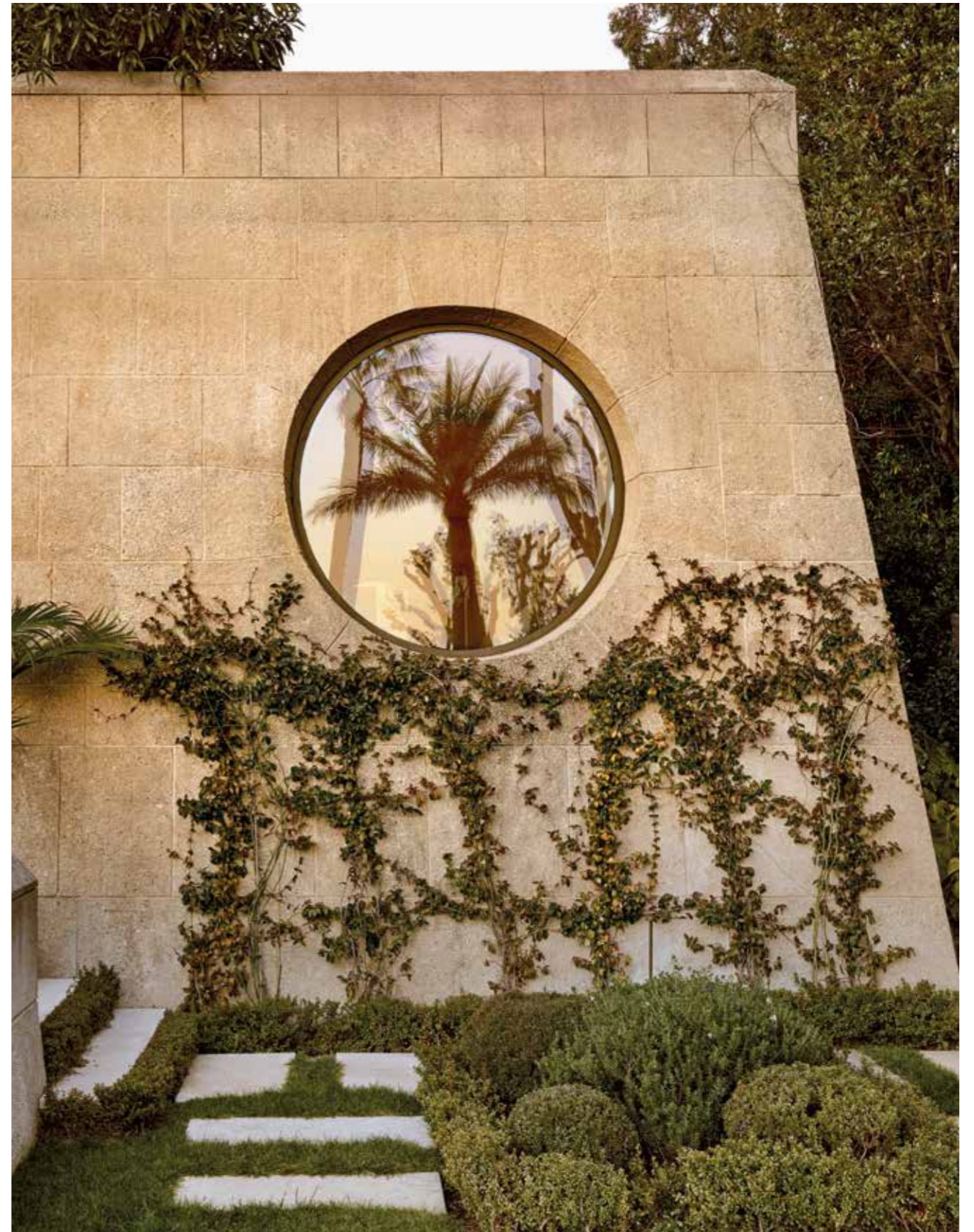
Las ventanas redondas del edificio de origen diseñado por los arquitectos Sir Basil Spence y Eugène Lizeró fueron fuentes de inspiración para varios elementos en el interior del departamento, como las puertas arqueadas y los techos abovedados.